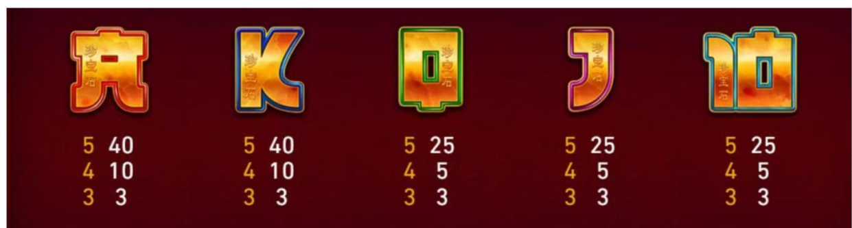
Figura 4 tabella dei pagamenti 3