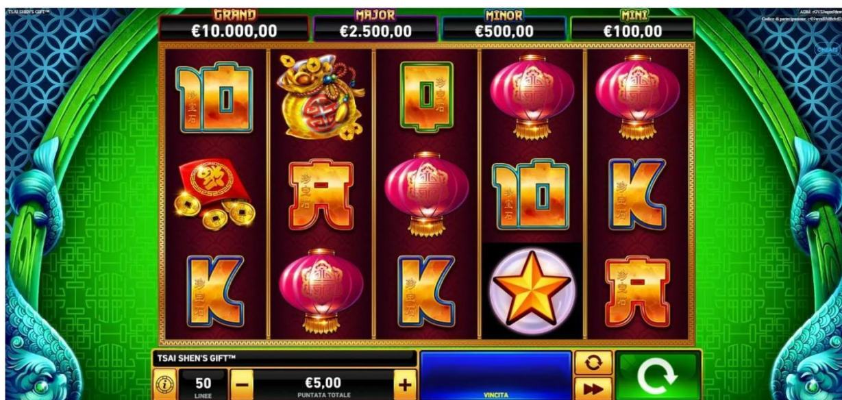
Figura 1 Schermata principale

Slot a 5 rulli e 50 linee, lo scopo di TSAI SHEN'S GIFT è quello di ottenere combinazioni di simboli vincenti, facendo girare i rulli.