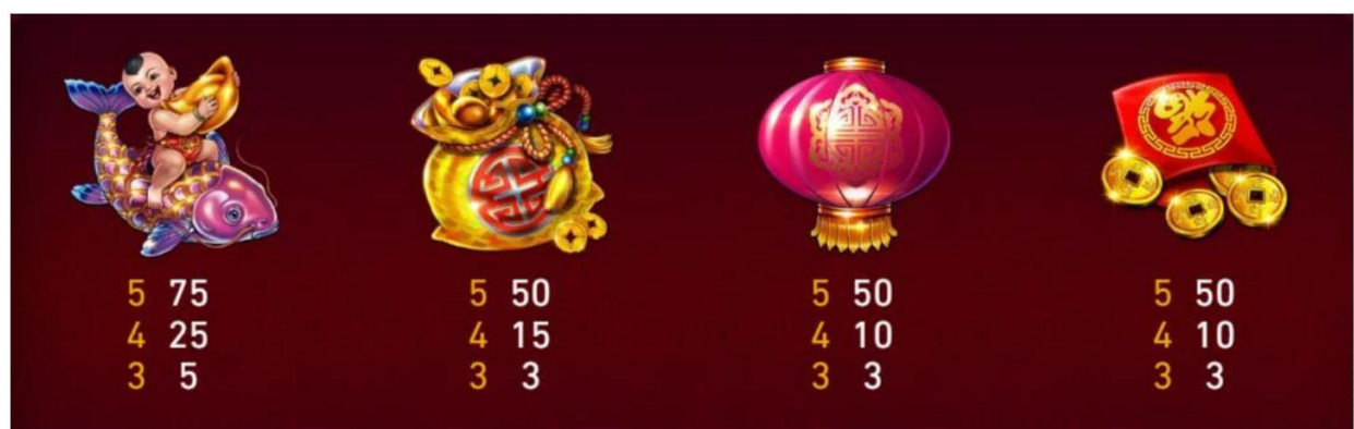
Figura 3 tabella dei pagamenti 2