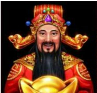
Figura 6 Simboli Tsai Shen

Il simbolo Wild è rappresentato dal Tsai Shen. Il simbolo Wild può sostituire qualsiasi altro simbolo, ad eccezione dei simboli Scatter e Perla, per ottenere la migliore combinazione possibile.