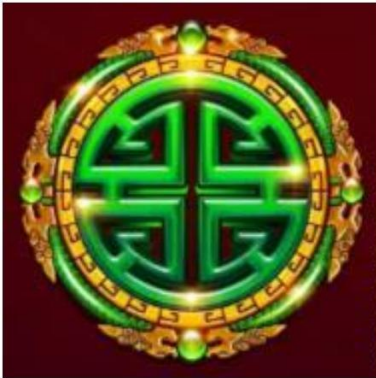
Figura 5 Simbolo Scatter Giada

Il simbolo Scatter è la Giada. Tre o più simboli Scatter ovunque attivano la Funzione Partite Gratis.